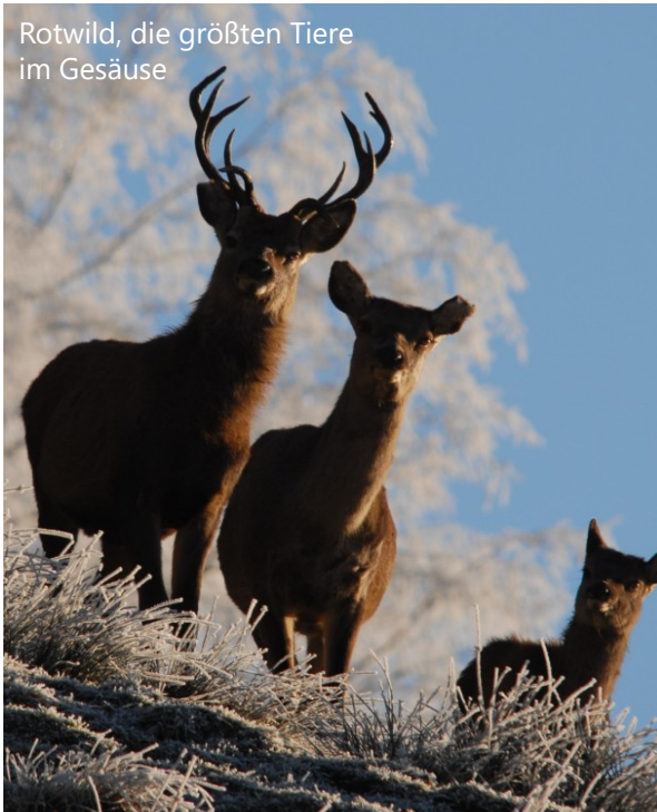
Rotwild, die größten Tiere im Gesäuse

Rotwild ist zwar heimisch, verbrachte aber in früheren Zeiten die harten Wintermonate fern der Berge in Auwäldern. Diese Auen sind heute nicht mehr vorhanden oder die Wanderwege dorthin versperrt, daher wird Rotwild im Winter bei uns gefüttert. Als Alternative bietet sich eine starke Verringerung der Rotwilddichte an. Wenige Tiere könnten auch ohne Fütterung ausreichend Nahrung finden. Allerdings wäre dieser Ansatz nur über die engen Nationalparkgrenzen hinausgehend auf großer Fläche umsetzbar.